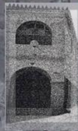
Zawiya Sidi Moussa