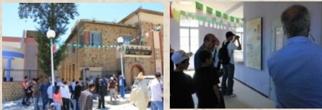
Musée des Ath Waghlis (El Flaye - Bibliothèque Municipale)