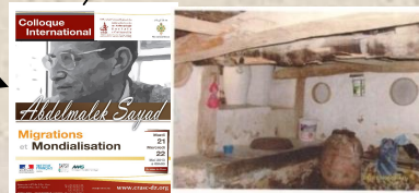
Maison Kabyle Traditionnelle du sociologue Abdelmalek Sayad Village Aghbala, Commune de Ath Jellil