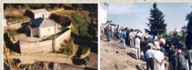
Zawiyya Ahmed Zerruq à Izzeruken al-Barnussi. (Souk ou Fella)