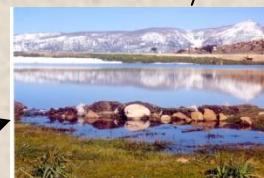
Aguelmim Yiker (Le lac du mouton) à Tibane a été proposé au classement comme site naturel

Partenaires : Direction de la Culture ó Direction du Tourisme ó Comité de Village Izzerouken ó Comité de Village Sidi Hadj Hessaïne - Association Ikhulaf n'Ath Waghlis - Comité de Village Imeghdasen (Akfadou).