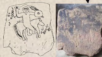
Découverte en décembre 2009 au lieu dit Azaghar, la stèle Lybico-berbère de Semaoune présente une forte similitude avec les stèles figurées de la série Abizar (Grande Kabylie)