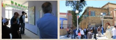
Musée des Ath Waghlis (El Flaye - Bibliothèque Municipale)