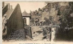
La mine de fer de Timezrit a joué un rôle dans la formation du syndicalisme en Algérie.