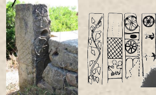
Stèle Lybico - Romaine du village Izoughlamène (Tifra).

Partenaires : Direction de la Culture ó Direction du Tourisme - Bibliothèque Municipale de El Flaye ó Bibliothèque Municipale de Sidi Aïch ó Comité de Village Izoughlamène - Comité de Village Tirghwa (Adekar).