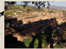
Les aqueducs romains sur le territoire des Ath Jellil et Fenaia aboutissent à Tubusuptu et les citernes al-Arioua