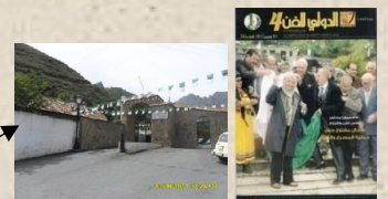
Inauguration du Colloque Scientifique du Festival International du Théâtre de Béjaïa à partir du Musée du Moudjahid - Ifri

Partenaires : Direction de la Culture ó Direction du Tourisme - Comité de Village Seddouk ou Fella - Musée d'Ifri