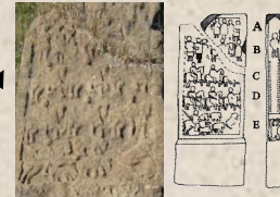
Stèle Lybico - Romaine de Tazrouit (Commune d'Adekar)