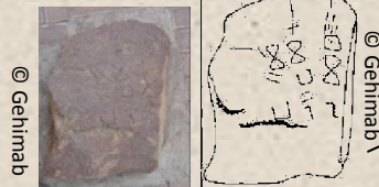
Stèle épigraphie de Maloussa (Sidi Aïch). Elle date probablement d'avant le présent.