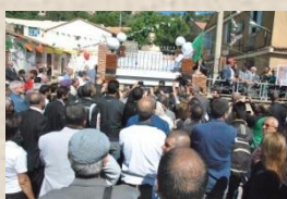
Souk ou Fella (Buste de Mohand Cherif Sahli, théoricien du nationalisme algérien)