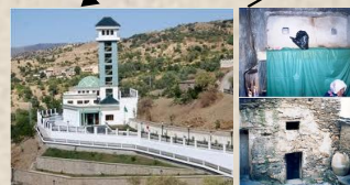
Seddouk Mausolée et Khalwa Cheikh Aheddad