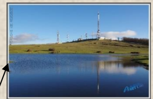
Antenne d'Akfadou Pique Nique Géant