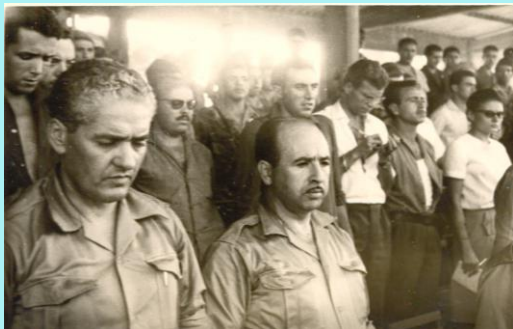
Le Commandant Kaci et Krim Belkacem à Béjaïa le 03 juillet 1962.