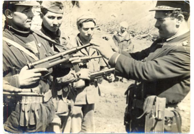
Le Commandant Kaci en mission d'inspection à Sdrata en 1957