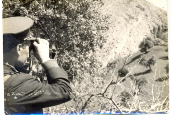
Le Commandant Kaci en opération de surveillance dans les années 1956