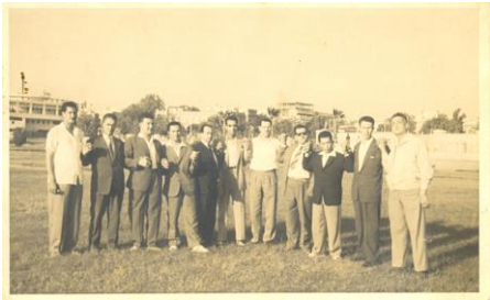
En 1958 à la Conférence de Casablanca, en compagnie de Boussouf, Boumedienne, Krim, Ben Tobbal,...