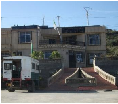
Tiniri, centre administratif de la commune de l'Akfadou. Ici, le siège de l'A.P.C.

Le but est de sensibiliser les esprits sur un développement local s'appuyant sur la mobilisation des ressources locales et des savoirs faire issus de la tradition.